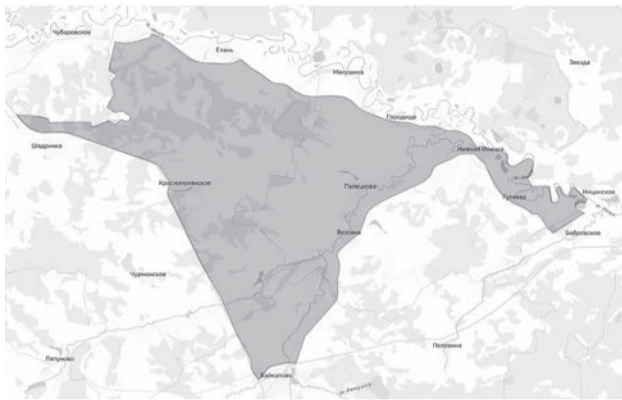
Граница участка общедоступных охотугодий.

В последнее время в среде охотников живо обсуждалась новость о размещении