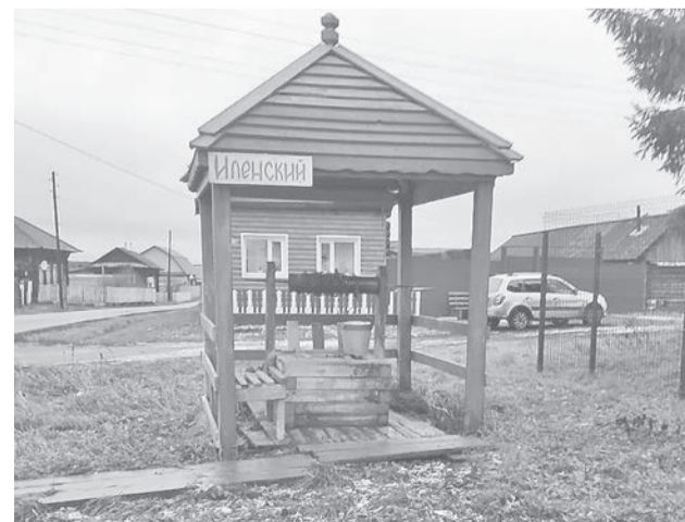
Нижеиленские ребята из подросткового клуба «Познай себя» ухаживают за колодцем.