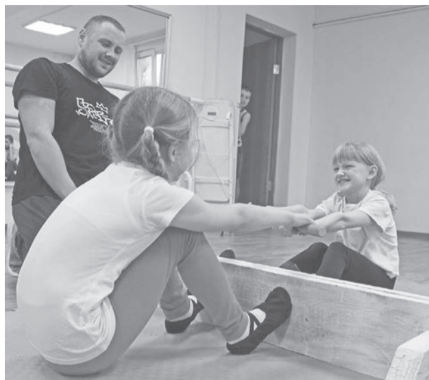
Соревнования прошли эмоционально, в упорной борьбе.

Правила соревнований довольно просты. Участники садятся друг напротив друга, упираются ногами в доску и перетягивают деревянную палку. Победа в схватке засчитывается, если одному из борцов удалось перетянуть соперника или если соперник выпустил палку. Поединок длится до