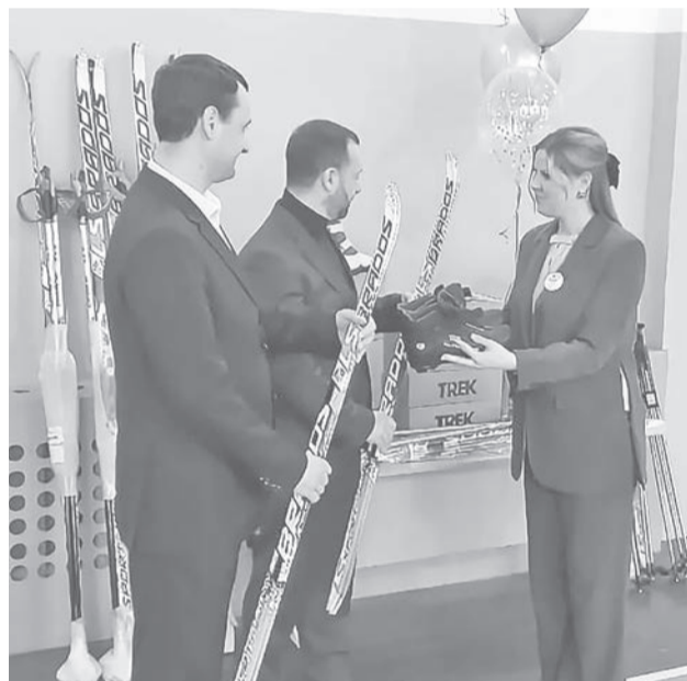
Комплекты лыж вручили Вязовской школе.